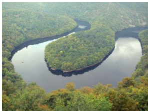
Méandre de Queuille