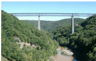
Les Fades, Barrage et Viaduc